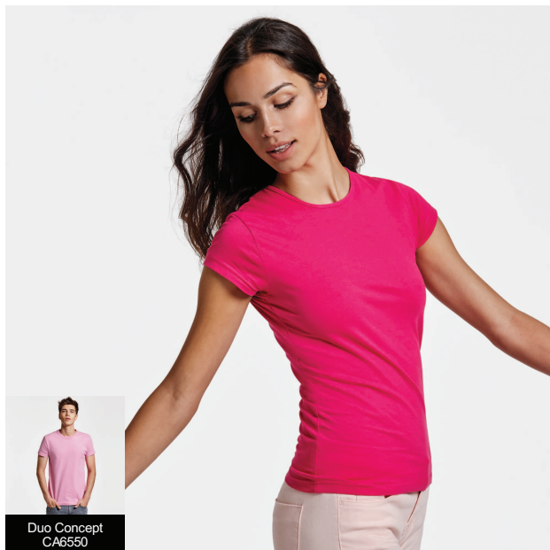
Duo Concept CA6550